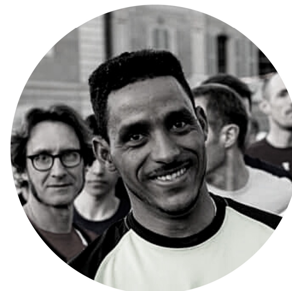
T S E G A Y G E B R E M E D H I N