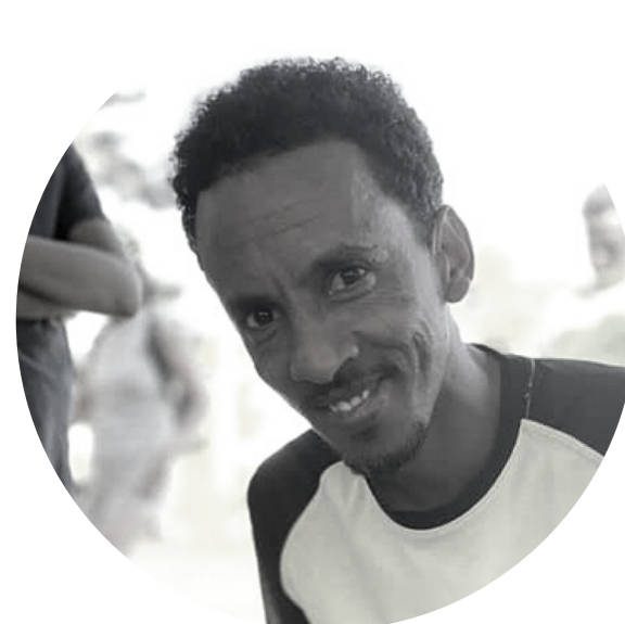
T E S F E A T E W E L D E