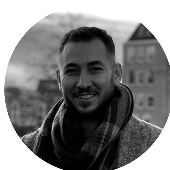
M A A S O M S H A M D E E N